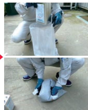
樹脂と骨材の混練

キットプライマーを所定量刷毛又はローラーにて塗布します。 ※コンクリート・銅板下地の場合のみ