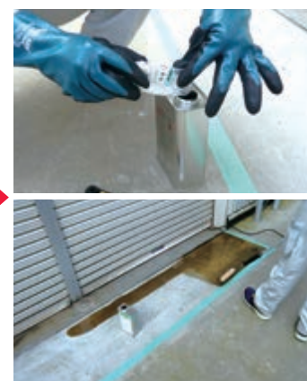
プライマー塗布(JCIIのみ)

キットプライマーを所定量刷毛又はローラーにて塗布します。 ※コンクリート・銅板下地の場合のみ